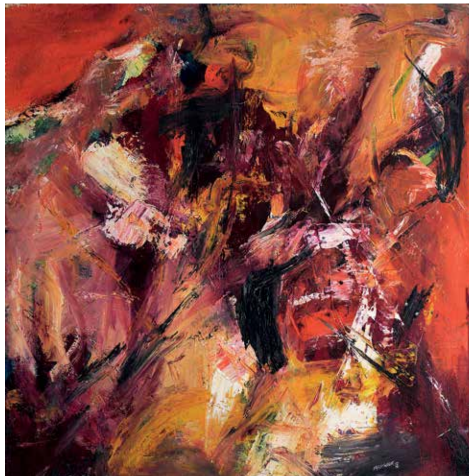
„Shout it loud“, Öl / Leinwand, Sammlung des BKH Lienz