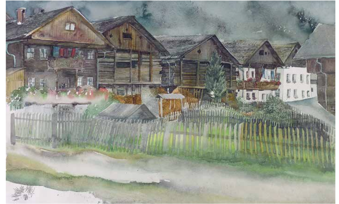
„In Obertilliach“, Aquarell, 1984